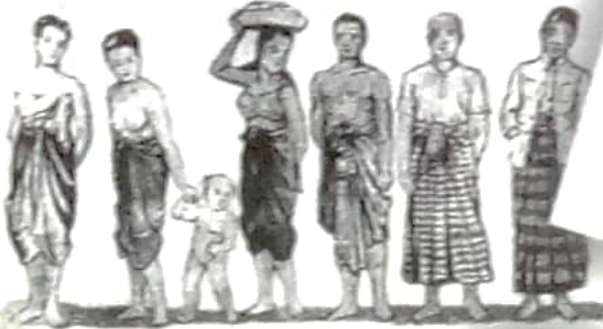
ชนเล็กแต่งกายแบบนี้