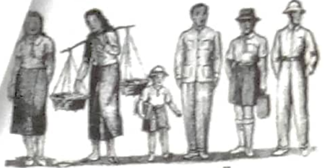
ชนแต่งกายแบบนี้